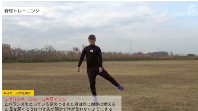
半分ボール/片足開き