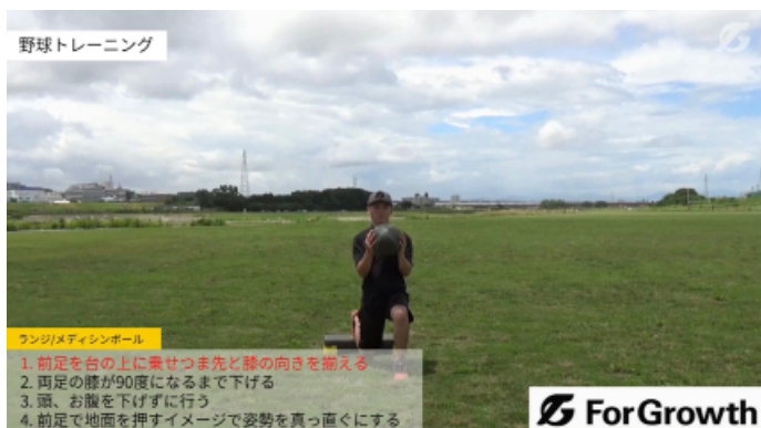
ランジ/メディシンボール