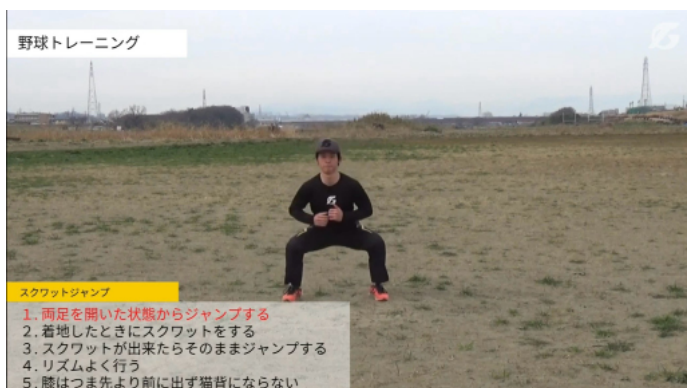
スクワットジャンプ