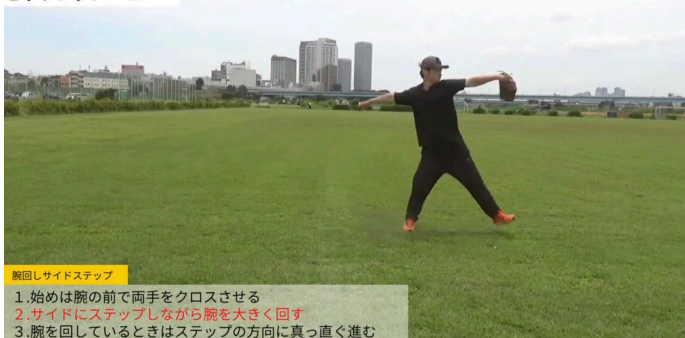
腕回しサイドステップ